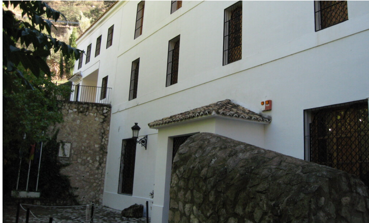
Ecomuseo del Río Caicena