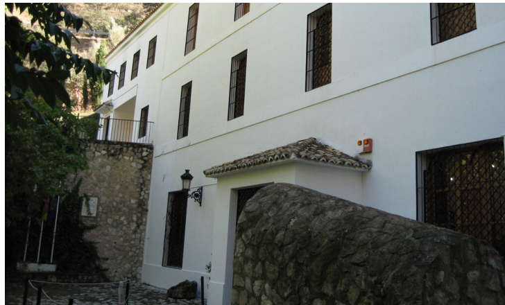
Ecomuseo del Río Caicena